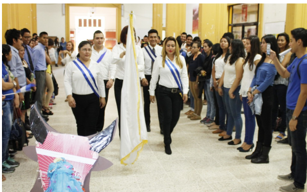
Entrada del Pabellón Nacional en el edificio de esta Facultad