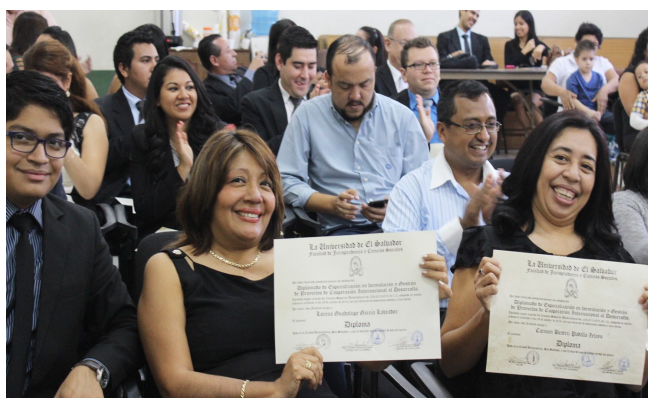
Profesionales muestran su satisfacción durante la clausura