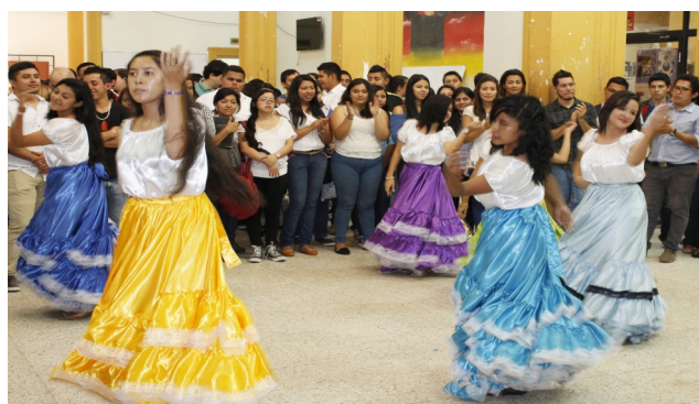
Grupo de Danza Folclórica del Centro Escolar Morazán