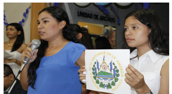
Exclamación de estudiantes del Curso Derecho Municipal al Escudo Nacional