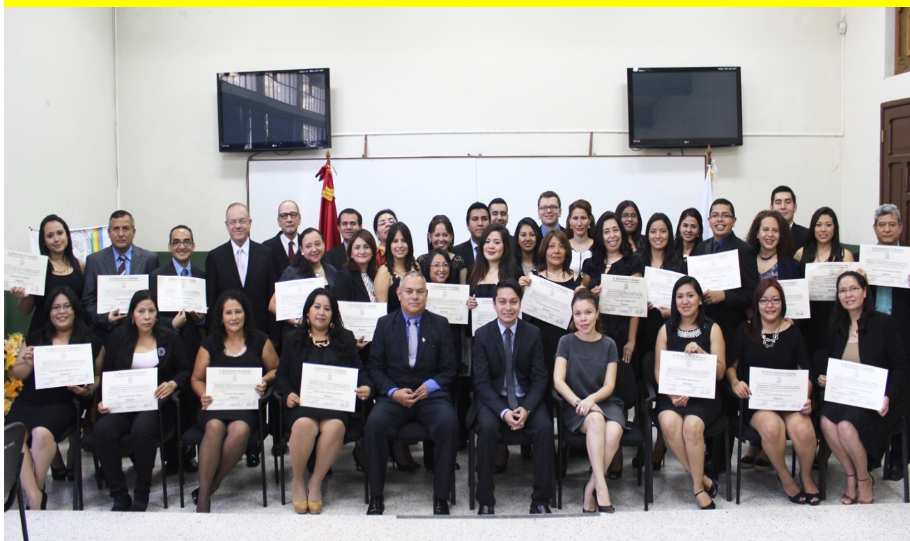
Señor Decano de esta Facultad acompaña a profesionales del Diplomado: “Especialización, en Planificación y Gestión de Proyectos de Cooperación Internacional”