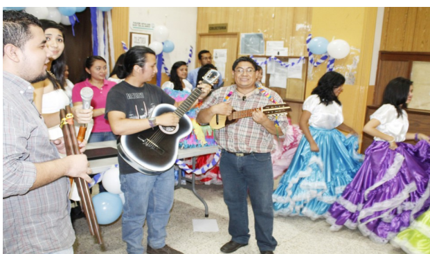
Música a cargo de estudiantes de la Universidad